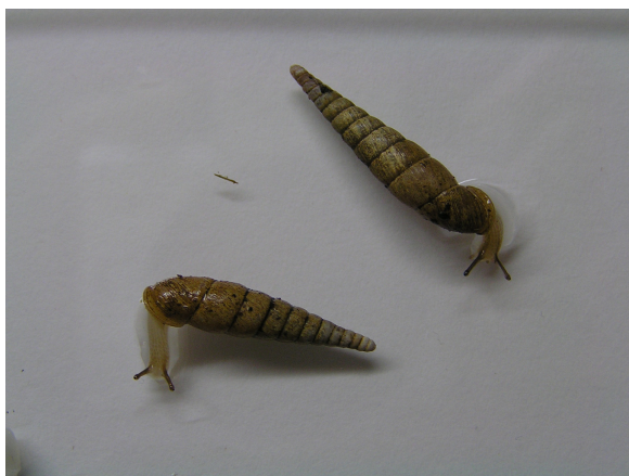
●ホソヤカギセル Mundiphaedusa hosoyaka (Pilsbry, 1905) 採集地：矢作川河畔林