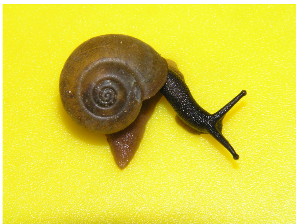
●ヒメビロウドマイマイ Nipponochloritis perpunctatus (Pilsbry, 1902) 採集地：豊田市自然観察の森