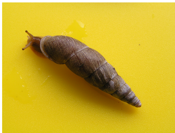
●オオギセル Megalophaedusa martensi (Martens, 1860) 採集地：猿投山山麓