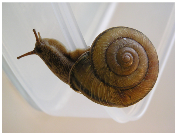
●イセノナミマイマイ Euhadra eoa communisiformis Kanamaru, 1940 採集地：愛知みずほ大学 クラブハウス裏