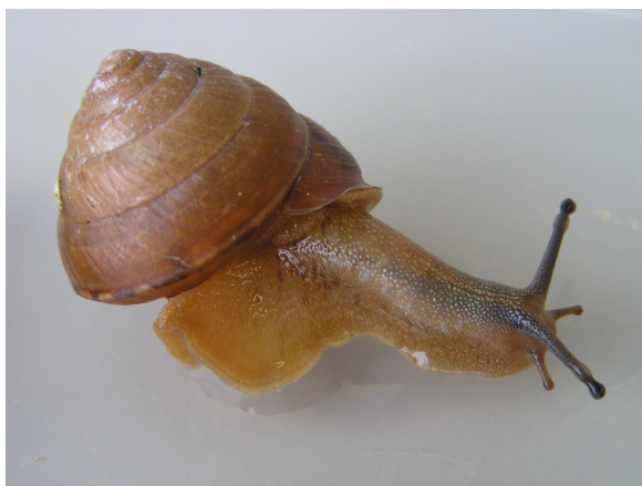
●ニッポンマイマイ Satsuma japonica (Pfeiffer, 1847) 採集地：豊田市自然観察の森