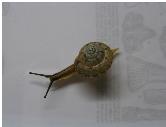
●カドバリニッポンマイマイ Satsuma japonica carinata (Pilsbry & Gulick, 1902) 採集地：豊田市平戸橋町